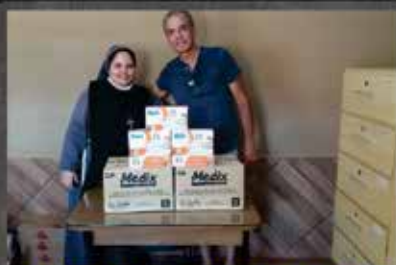
DOAÇÃO DO GRUPO TERÇO DOS HOMENS PARÓQUIA SAGRADO CORAÇÃO DE JESUS