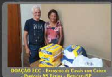
DOAÇÃO ECC - ENCONTRO DE CASAS COM CARISMO - PARÓQUIA NS FATIMA - BOTUCATU/SP