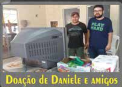
DOAÇÃO DE DANIELE E AMIGOS