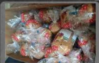
DOAÇÃO DA DONA ZILÁ IRMÃ DE UM DE NOSSOS IDOSOS DA CRECHE.