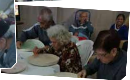
Atividade com os Idosos